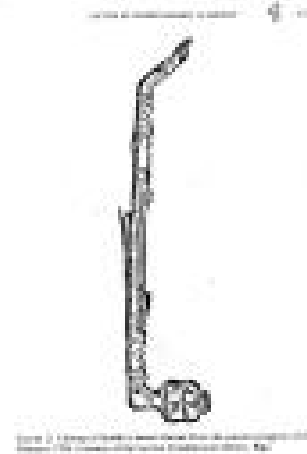
Abb. 3: So könnte Anton Stadlers Bassettklarinetten ausgesehen haben