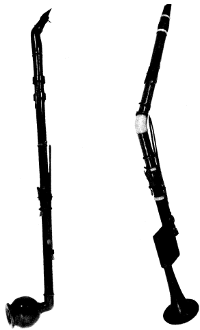
Abb. 2: zwei Bassethörner mit sechs bzw. acht Klappen (v.l.n.r.), spätes 18. Jahrhundert