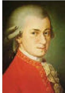
Abb. 1: Wolfgang Amadeus Mozart (1756 – 1791)

meiner Faszination für seine Musik, wie schon im Vorwort erwähnt, habe ich mich auch entschieden, meine Maturaarbeit über eines seiner unbestritten besten Kammermusikwerke, welches gleichzeitig auch als eines der Grossartigsten in der gesamten Kammermusikliteratur gilt, zu schreiben.