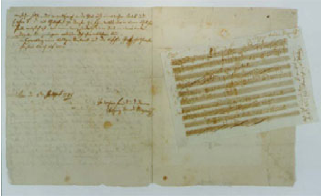
Abb. 4: Schriftstück von Mozart